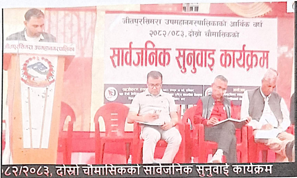
८२/२०८३, दोस्रो चौमासिकको सार्वजनिक सुनुवाइ कार्यक्रम