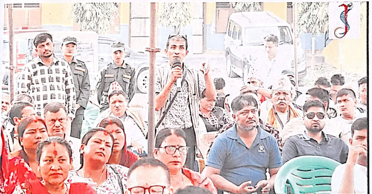
मकको सावेजनिक सन्वाइ कार्यक्रम जीतपुरसिमरा उपमहानगरपालिका