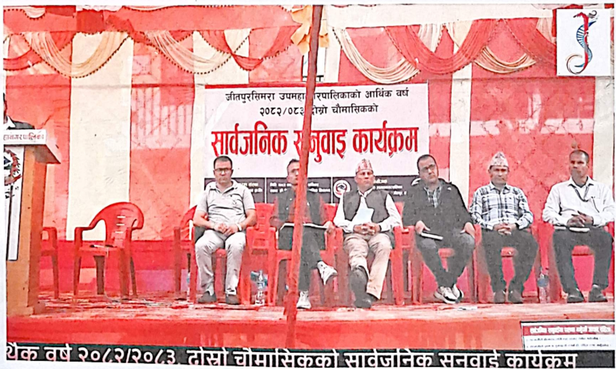
थेक वर्ष २०८२/२०८३, दोस्रो चौमासिकको सार्वजनिक सुनुवाइ कार्यक्रम